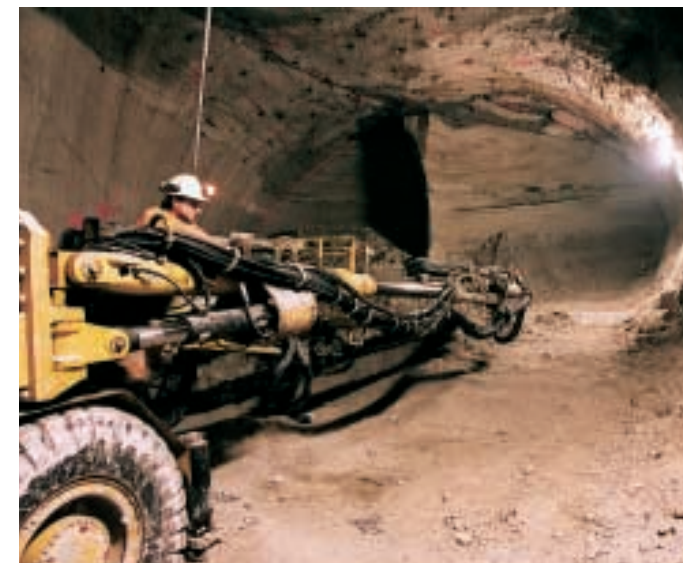
Ganz unten: Cameron Mills mit seiner LEICA TCA1800-Ausrüstung unterwegs in der Kaverne an der Scotts Creek, wo Baustellenzugang und Tunnels aus vier Richtungen zusammen treffen. Der Abtransport des Aushubmaterials erfolgte oberirdisch in Schiffsbargen – praktisch lautlos für die Anwohner des Tunks Park.