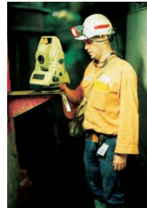
Links: Für die Steuerung und Kontrolle sind in den Tunnels Konsolen mit genau bekannten Koordinaten angebracht. Die Arbeit in Dunkelheit, Staub und Nässe fordert Mensch und Gerät.